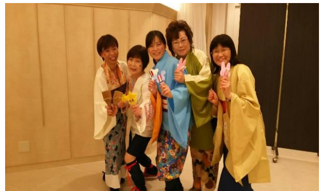
写真3 よさいこいの衣装を着て笑顔いっぱい皆さん。