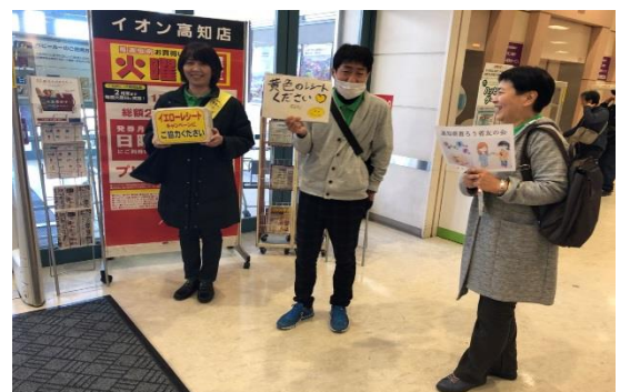
写真5 東入り口。「黄色いレシートをください」と書いた紙を持ってお客さんに呼びかけている様子