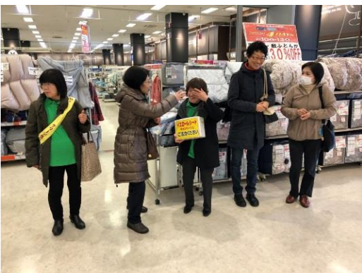
写真4 西入り口。襷がけ、レシート回収ボックスを持ってお客さんに呼びかけている様子